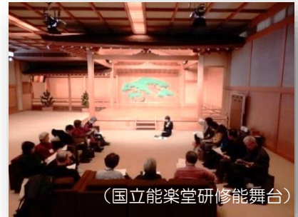
(国立能楽堂研修能舞台)

その後、平成15年度には「老壮セミナー」、さらに平成21年度には「いきいきセミナー」と名称を改め、現在は、1年間に2回前期と後期の講義を、市民が参加しやすい東西の会場に分けて実施しています。