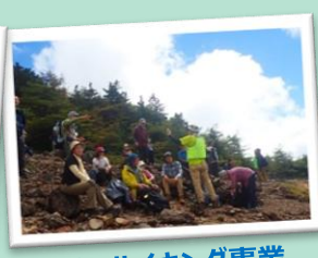
登山・ハイキング事業