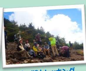
槍ヶ鞘トレッキング