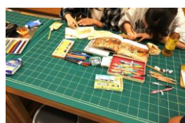
サマーペイントデー（8月）