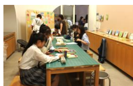
おしえて！この夏やりたいこと（7月）

青少年フロアを利用する青少年同士やスタッフとの交流を目的として、年に10回ほどB2青少年フロアで開催されている交流イベントです。