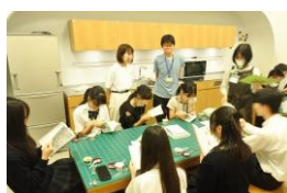
みんなでゲームしよう（9月）

夏にやりたいことをカードに書いてもらい貼り出した7月、夏装飾に合わせ、B2の森に潜む動物のイラストを描いてもらった8月、2つのゲーム「みんなで本をもちよって」「57577」をした9月。毎回違ったテーマで、青少年と楽しく交流を深めました。