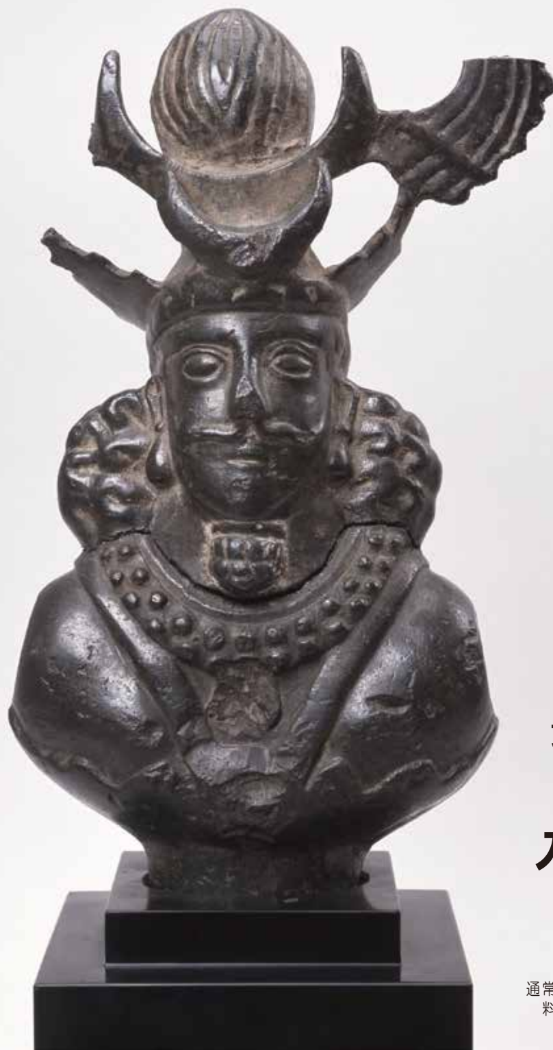
《帝王胸像》イラン 5～7世紀 青銅