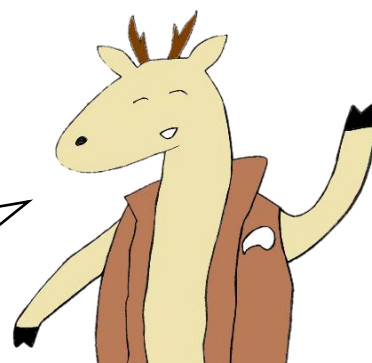
市活のしかのさん

そんな風に思っているあなた！ LINE 公式アカウントは実は無料でも使えて 市民活動にもとっても役に立つんです。 アカウントを作成してあなたの活動に役立ててみませんか？