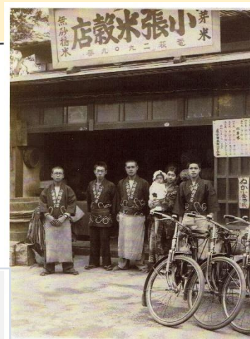
親子三代続く小張精米店 （創業初期）