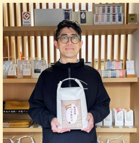
小張精米店三代目（お米マイスター）

杉並区西荻窪にある、三代続く小張精米店の長男として生まれる。家族経営の家業の影響で多くのお米を試食する中で育つ。大学を卒業後、税理士試験に合格。一旦は会計事務所に勤務するも、働く中で、中小企業の現状に触れ、家業を継ぐ決心を固める。結婚を機に、店の内装や、商品パッケージの一新、新商品開発を建築デザイナーである奥様と二人三脚で推し進める。 家族一体となって、新しいお米屋さんの在り方を体現中。