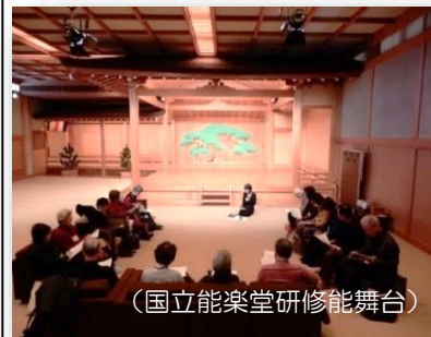
(国立能楽堂研修能舞台)

その後、平成 15 年度には「老壮セミナー」、さらに平成 21 年度には「いきいきセミナー」と名称を改め、現在は、1 年間に2回前期と後期の講義を、市民が参加しやすい東西の会場に分けて実施しています。