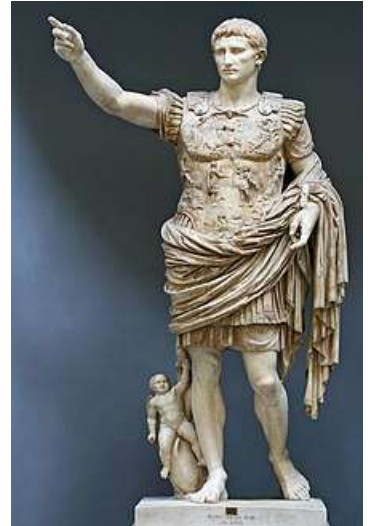
ブリマボルタのアウグストゥス （バチカン美術館所蔵）