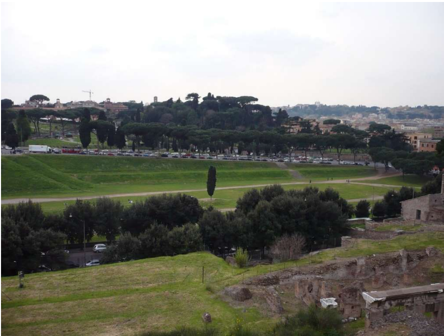
大戦車競技場跡（ローマ市）