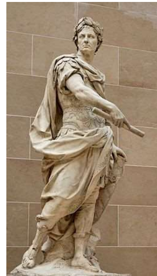
ガイウス・ユリウス・カエサル立像 （ルーヴル美術館所蔵）