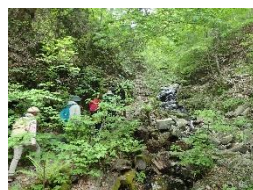
三頭大滝～野鳥観察小屋