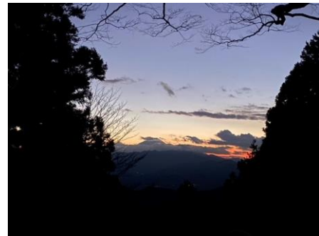
景信山山頂から見た富士山

山頂では富士山、反対側では都心の夜景を一望することができました。山頂では、写真撮影に没頭する人、温かい飲み物を飲んでまったりする人、各々違う楽しみ方で夜の景信山を満喫することができました。