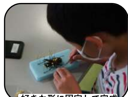
好きな形に固定して完成

夏休み恒例の標本教室！今年は午前・午後・夕方3部に分け、総勢47名の子供たちの参加がありました。『いつ・どこで・どんな虫が生息していたのか』標本は過去と未来をつなぐ自然の記録。標本作りをきっかけに、環境について考える機会となりました。