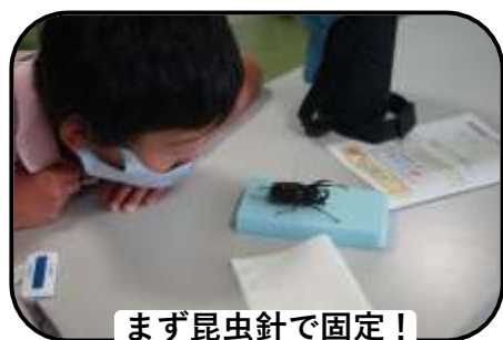
まず昆虫針で固定！