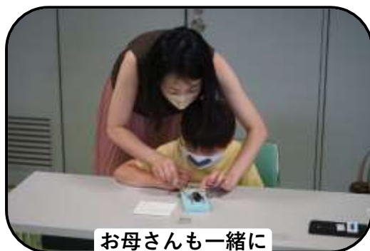
お母さんも一緒に