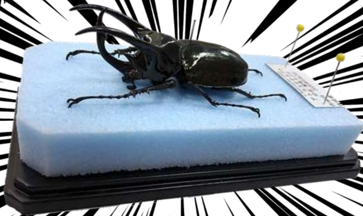
挑戦した標本「アトラスオオカブト」