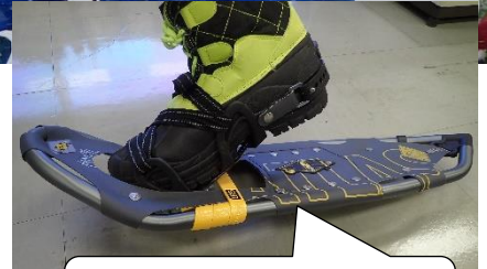
これがスノーシュー!!

群馬県のみなかみ町でスノートレッキングをやってきました！ 全国的な雪不足と言われていますが、前日からの（恵みの!?） 雪もありスノーシューを思う存分楽しむことが出来ました！ トレッキング班を2班、雪遊び班を1班の計3班に分かれプログラムを開始しました。 トレッキング1班はマチガ沢と一ノ倉沢の間くらいまで歩くことができ、2班はマチガ沢まで行って雪遊びをしました。雪遊び班は近くの湯檜曾川の河原で、雪像作りや宝探し、スノーフラッグなど雪の中ならではの楽しみ方を沢山体験しました。 雪上でのトレッキングは専門的なリスク管理も必要ですが、専門のガイドさんが居れば誰でも簡単に楽しむことが出来ます。今回お世話になった、みなかみの「レイクウォーク」さんは個人向けのツアーもやっています。中々東京では体験できない雪遊びを皆さんも是非体験してみては？