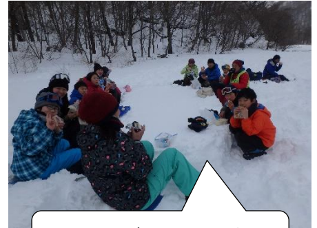
雪のテーブルでお昼ご飯