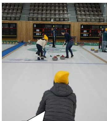
狙い通りに いけるかな？