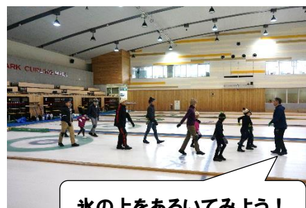
氷の上をあるいてみよう！