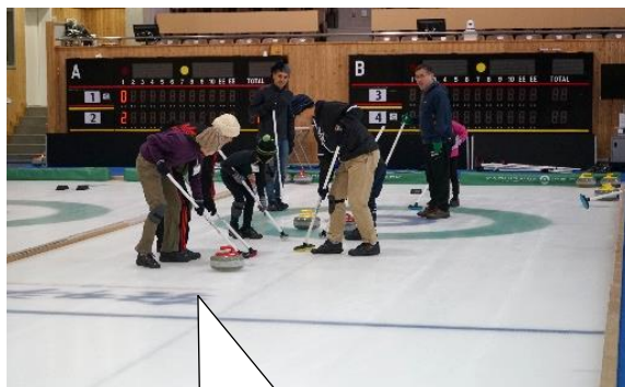
みんなで力を合わせて ショットを決めるよ!!