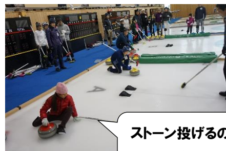
ストーン投げるの むずかしい～