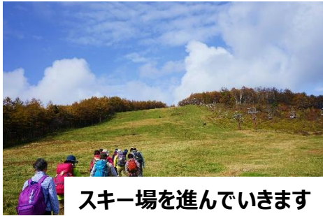
スキー場を進んでいきます