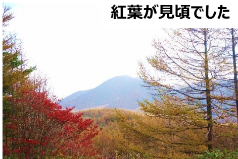
紅葉が見頃でした