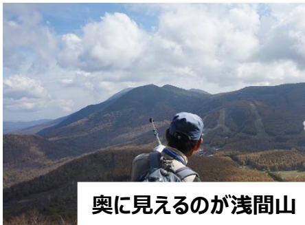
奥に見えるのが浅間山

曇り空から時折晴れ間がさす中、32名の方にご参加いただき地蔵峠駐車場から湯の丸山山頂を目指しました。台風19号の被害の為、当初の予定と少しルートの変更がありましたが、途中インタープリターより白樺などの高山植物や、例年より少し遅かった為にちょうど見ごろとなった紅葉の仕組みなどについての解説もあり、自然を満喫できる山行となりました。