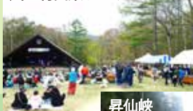
川上村山菜まつり