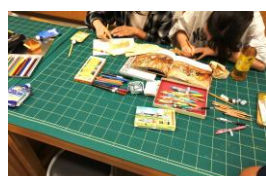
サマーペイントデー（8月）