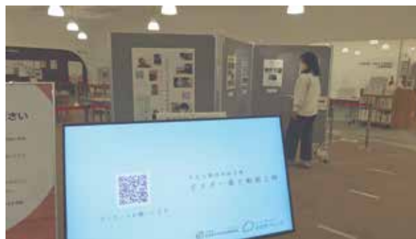
▲ポスター展示と動画上映の様子

大学生の団体や落語の団体など様々な分野から9団体の参加がありました。参加した方々とは、ポスターと動画ができる過程