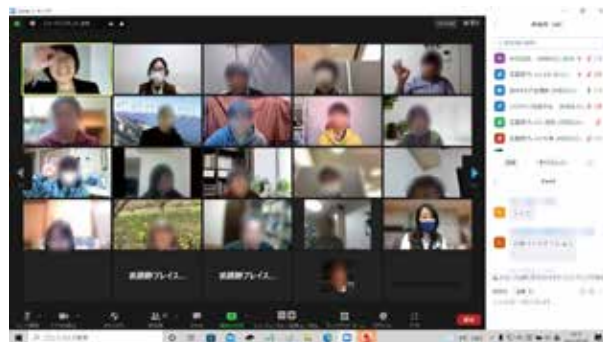
▲Zoomでのオンライン講座の様子

終了後のアンケートでは「次の日からすぐ実践できる内容が学べた」「ファシリテーションや会議というものについての気づきがあった」などの意見がありました。