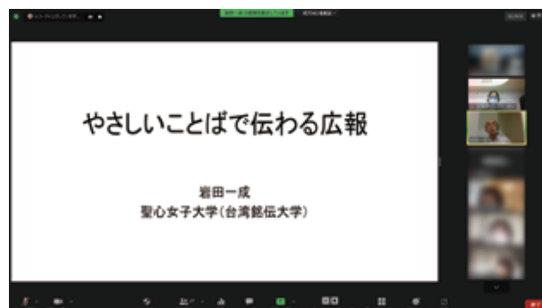
▲やさしいことばで伝える広報のZoom画面

報と簡潔な文章の大切さを学ぶことができました」「見てわかる文章にしている学校の実話は、とても参考になりました。今後の資料作りを見直したいと思います」など、やさしいことばを使った伝える広報のヒントやコツを感じることができたという感想が寄せられました。