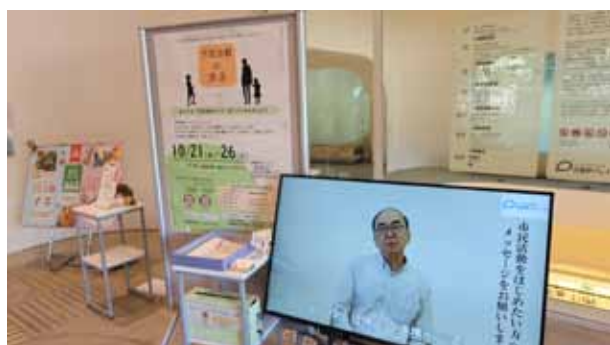
▲武蔵野プレイスにてサイネージ上映

登録市民活動団体の中から様々な分野で活動している4名にご協力いただき、市民活動をはじめたきっかけや理由を植物の種になぞらえた「市民活動のタネ」として、