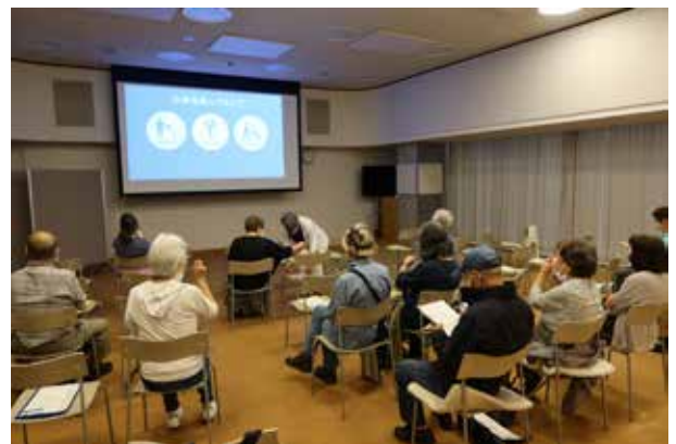
▲4階フォーラムでの上映前の様子

3回の上映に100名ほどの参加があり、「自分でもできることを今日からはじめたい」「何かの形で支援したい」「市民にできることを学ぶことができるとうれしい」などの感想が寄せられ、国際的な課題の解決へ向けた活動へ一歩進むきっかけの場となったようです。