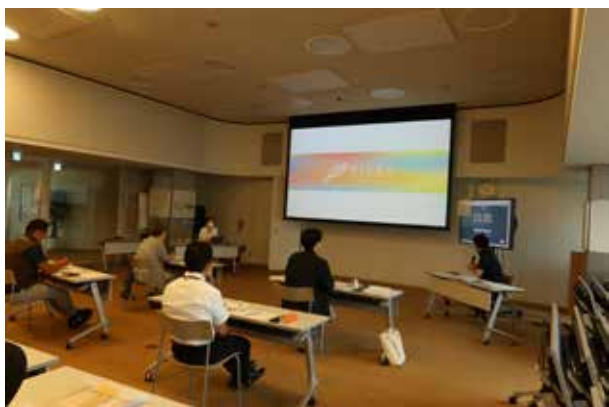
▲団体のプレゼンテーションの様子